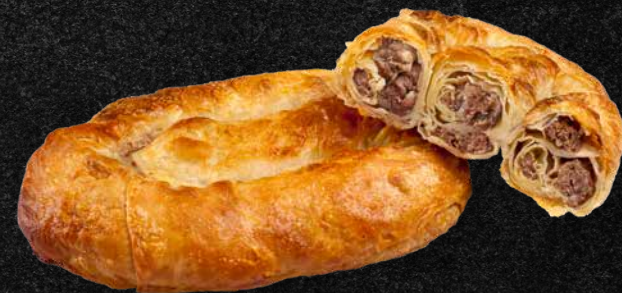
100768 100746 BUREK JUNETINA 190 G & 260 G