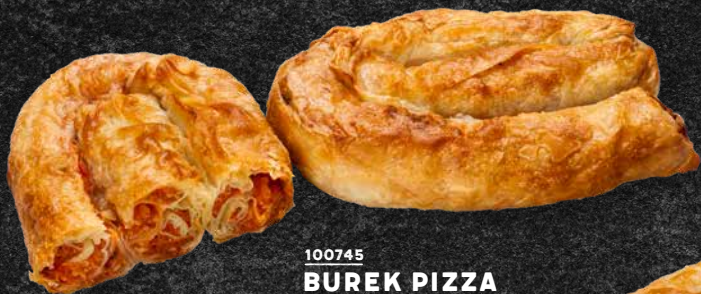
100745 BUREK PIZZA 260 G