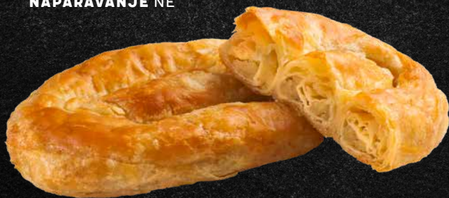
100577 100782 BUREK KRUMPIR 190 G & 260 G