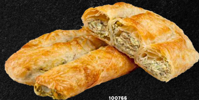
100766 100744 BUREK ŠPINAT & SIR 190 G & 260 G