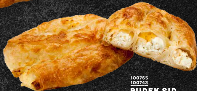
100765 100743 BUREK SIR 190 G & 260 G