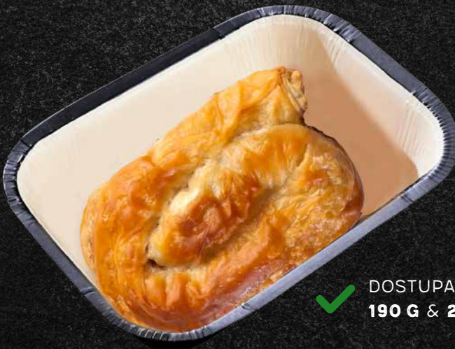
✓ DOSTUPAN U POSUDI 190 G & 260 G