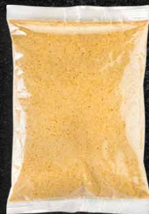
500 G 170 MM X 250 MM