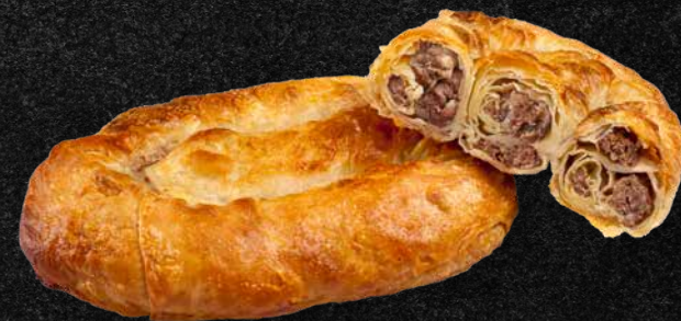
7-009 7-004 BUREK JUNETINA 190 G & 260 G