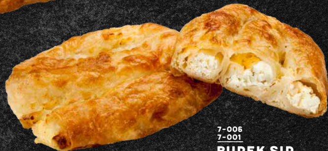
7-006 7-001 BUREK SIR 190 G & 260 G