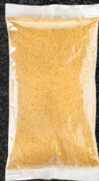
400 G 125 MM X 230 MM