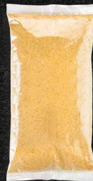
500 G 160 MM X 320 MM