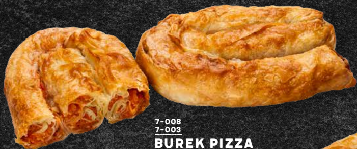
7-008 7-003 BUREK PIZZA 190 G & 260 G