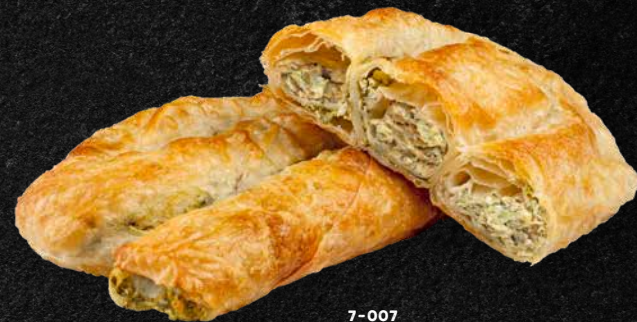
7-007 7-002 BUREK ŠPINAT & SIR 190 G & 260 G