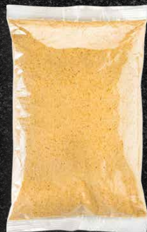
500 G 170 MM X 275 MM