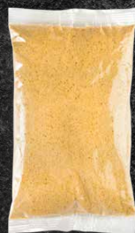
200 G 132 MM X 235 MM