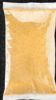
500 G 160 MM X 290 MM