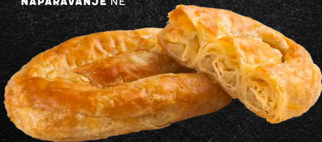
7-010 7-005 BUREK KRUMPIR 190 G & 260 G